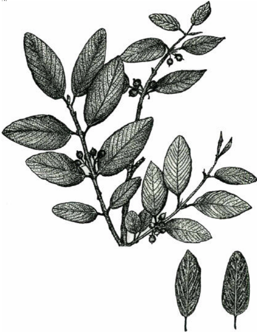
FIG. 3. Rama de Karwinskia Humboldtiana (Roem. & Schult.) Zucc y dos hojas vistas por el envés, mostrando las características manchas lineares glandulares a lo largo de las nervaduras.