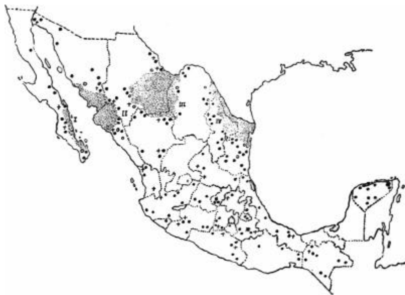
FIG. 1. Fisiografía de las Karwinskias de México. Los puntos indican los lugares donde se han colectado las especies: humboldtiana y calderonii. Los signos corresponden a: K. mollis Shl. (+), K. latifolia Standl. (o) y K. matudaea M.T.B.* Las cuatro regiones oscuras corresponden a las "zonas álgidas".