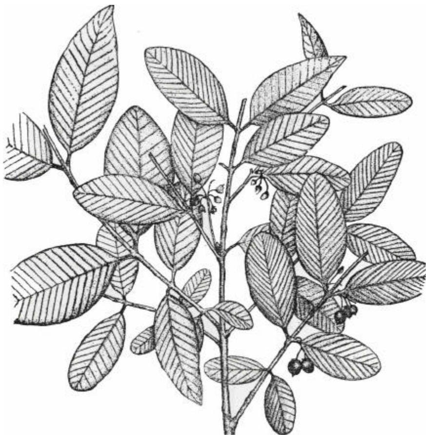
FIG. 4. Rama de Karwinskia calderonii Standl., en fructificación.