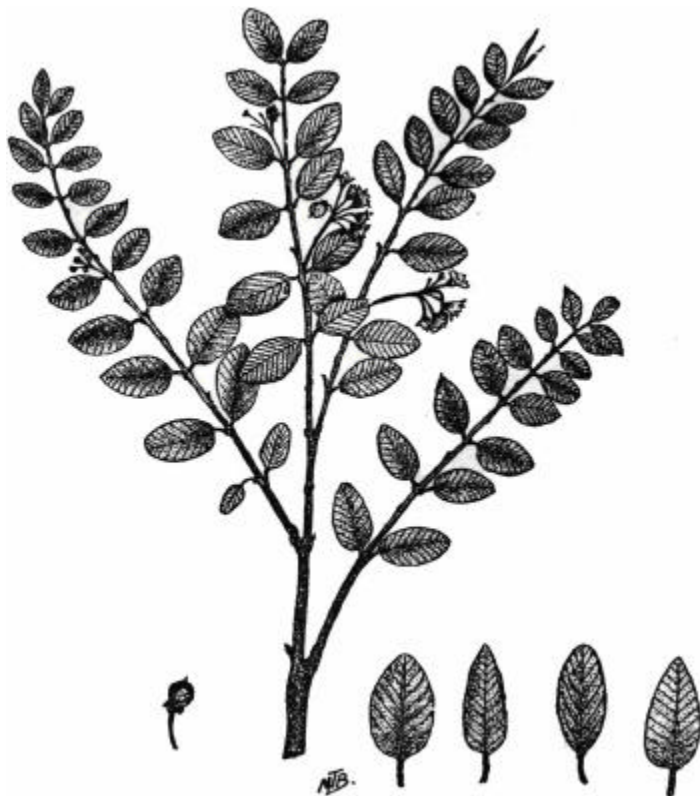
FIG. 5. Rama de Karwinskia matudaea M.T.B. en floración. Puede haber un ligero polimorfismo foliar pero conservando el tamaño reducido de los hojas.